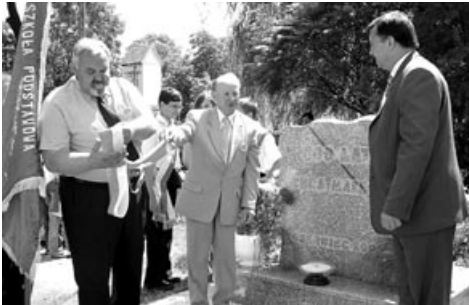
Jednym z elementów uroczystości było odsłonięcie i poświęcenie obelisku upamiętniającego 800 - lecie istnienia Tyńca Małego

18 czerwca rozpoczęły się obchody rocznicowe istnienia Tyńca Małego. Zostały one połączone z 70 - leciem wykonania kopii figury Matki Boskiej Fatimskiej, znajdującej się w kościele parafialnym, oraz 60-leciem Szkoły Podstawowej.