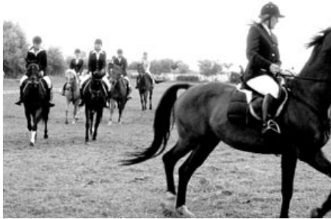
Pokaz hippiczny w wykonaniu uczniów PZS nr 1 z Krzyżowic

10 czerwca w Krzyżowicach odbył się piknik. Imprezę zainicjowało Stowarzyszenie Miłośników Krzyżowic, a współorganizatorami byli: Powiatowy Zespół Szkół nr 1 z Krzyżowic oraz Gminne Centrum Kultury i Sportu w Kobierzycach.