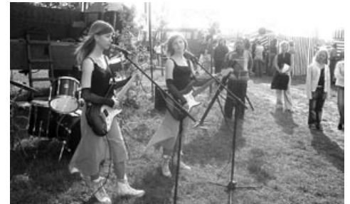
Duet dziewczęcy „JPLN”