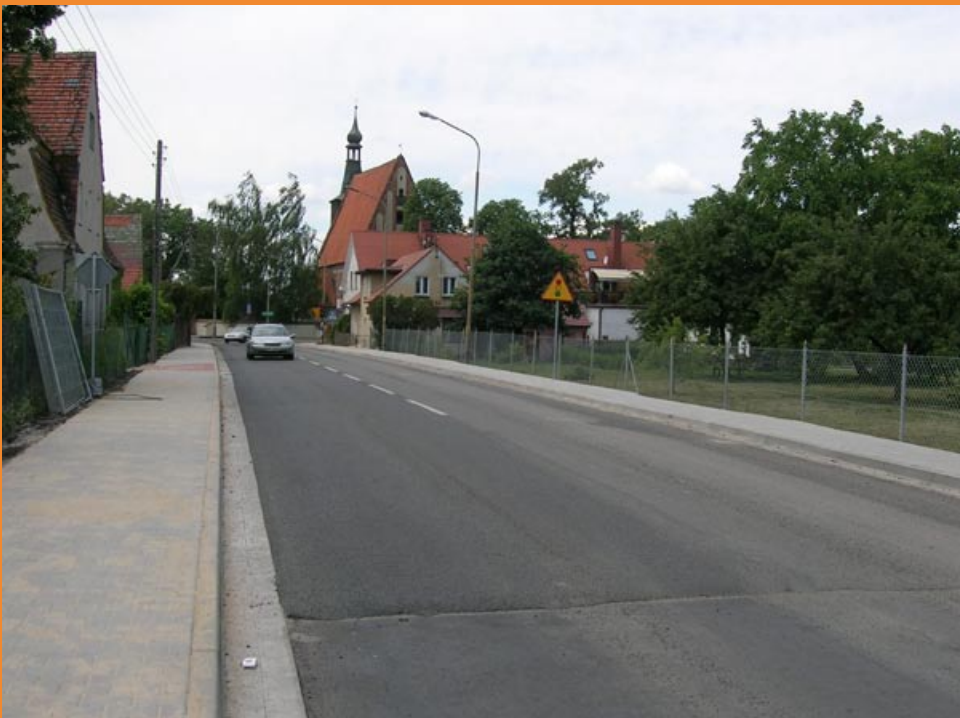
Tak wygląda ukończony fragment ulicy Kolejowej w Bielanych Wrocławskich

W kilku miejscowościach na terenie gminy Kobierzyce prowadzone są prace związane z budową dróg, parkingu i chodników.