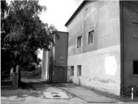
Tak obecnie wygląda świetlica w Domasławiu. Po remoncie dużo się zmieni

Zakończyły się przetargi na wybór wykonawców remontów i rozbudowy świetlic wiejskich w Rolantowicach, Dobkowicach i Domasławiu.