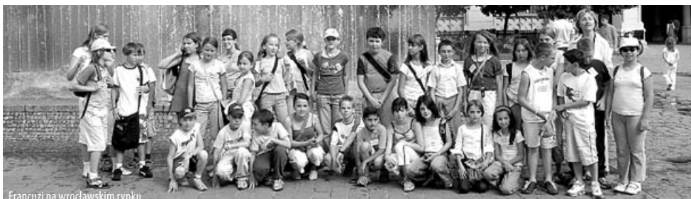
Francuzi na wrocławskim rynku